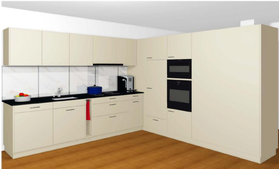
Küche Gartenwohnung UG

Die elfenbeinfarbene Küche ist grosszügig und mit modernen Küchenapparaten, inkl. Combisteamer, ausgestattet. Ein Sitzplatz, ein eigener Waschturm in der Wohnung sowie eine Garage und ein Aussen-Parkplatz gehören dazu. Als Pflanzenliebhaber/in werden Sie von den grossen Fenstersimsen (dicke Mauern) begeistert sein.