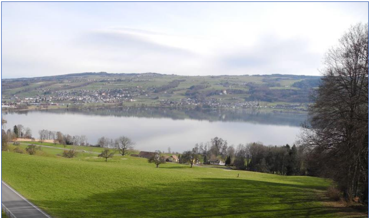
Aussicht auf den Baldeggersee

3.5-Zimmer-Gartenwohnung, UG mit Seeblick und im Grünen