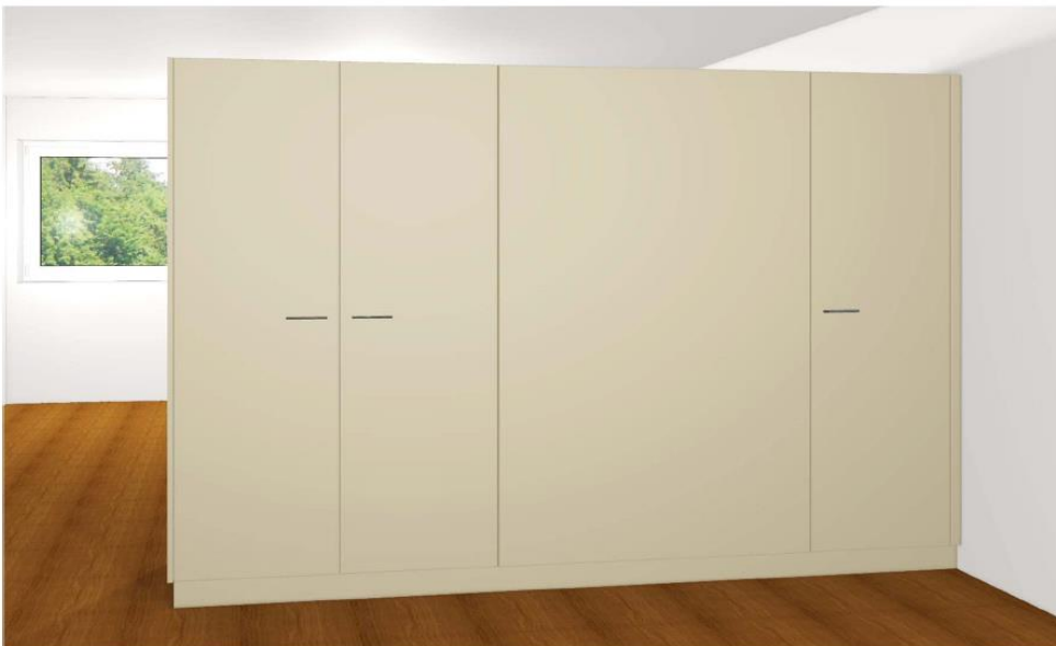
Rückseite Küche Gartenwohnung UG (Garderobe/Putzschrank)