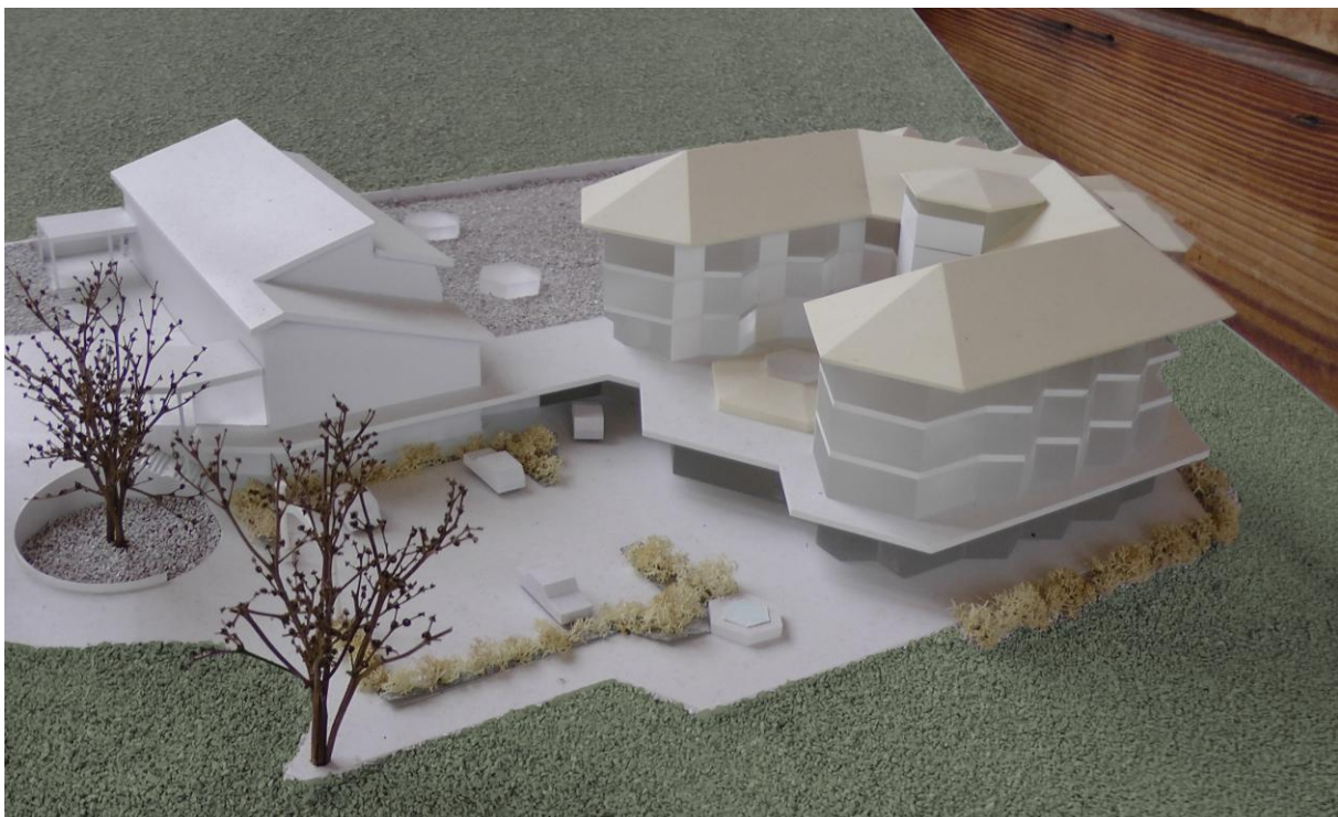
Modell „Natürliches Regenerationszentrum“