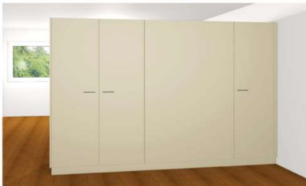
Rückseite Küche Gartenwohnung UG (Garderobe/Putzschrank)