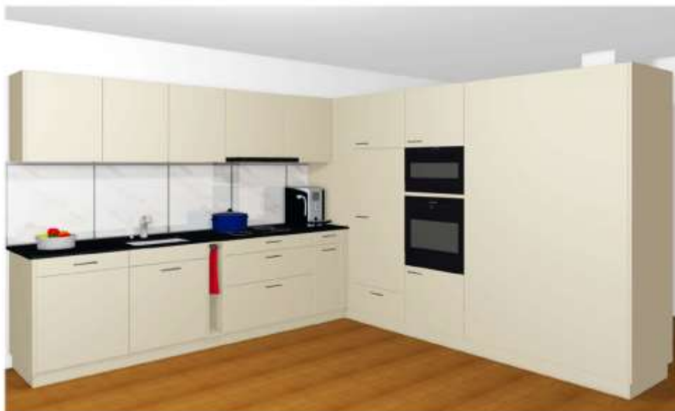
Küche Gartenwohnung UG

Die elfenbeinfarbene Küche ist grosszügig und mit modernen Küchenapparaten, inkl. Combiteamer, ausgestattet. Ein Sitzplatz, ein eigener Waschturm in der Wohnung sowie eine Garage und ein Aussen-Parkplatz gehören dazu. Als Pflanzenliebhaber/in werden Sie von den grossen Fenstersimsen (dicke Mauern) begeistert sein.