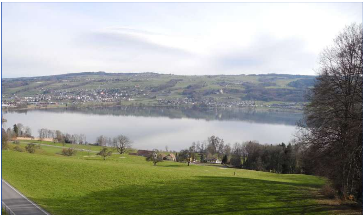
Aussicht auf den Baldeggersee

nach den neuesten elektrobiologischen Kenntnissen gebaut